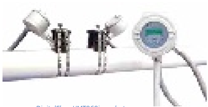
DigitalFlow XMT868i en photo avec transducteurs « clamp-on ».

Pour minimiser les effets de distortion du profil d'écoulement, des tourbillons et de l'écoulement transversal et fournir une précision maximale, vous pouvez installer les deux jeux de transducteurs sur la même conduite.